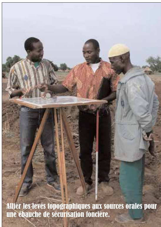
Allier les levés topographiques aux sources orales pour une ébauche de sécurisation foncière.

Certains services de l'Etat accueillent favorablement l'initiative . Les rencontres des structures nationales, notamment le Comité national de sécurisation foncière suggèrent une ouverture de plus de services étatiques