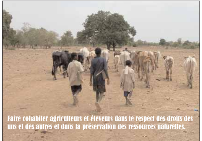
Faire cohabiter agriculteurs et éleveurs dans le respect des droits des uns et des autres et dans la préservation des ressources naturelles.

celles fournies par les services de l'Etat, ne concernent généralement que les superficies exploitées par spéculation et les terres aménagées. Du coup, les indicateurs jugés pertinents par les organisations de la société civile ne figurent ni dans la matrice des indicateurs du cadre stratégique de lutte contre la pauvreté (CSLP) ni dans celle des politiques sectorielles. Il en est ainsi de la fréquence des conflits selon