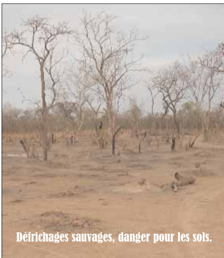
Défrichages sauvages, danger pour les sols.

La création du réseau foncier rural , en