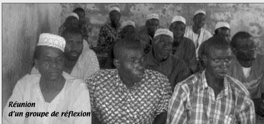
Réunion d'un groupe de réflexion

Comment faire converger des intérêts divergents ? C'est tout l'enjeu de la participation. Sur le foncier, cet arbitrage constitue un casse-tête pour tous : organismes de développement, autochtones, migrants... Car dans ce domaine et dans bien d'autres, le changement exige parfois de s'appuyer sur l'ordre établi tout en ayant comme finalité son bouleversement. Ce défi, le Projet de développement local de l'ouest Burkina (PDLO) tente de le relever. Cette opération pilote, de sécurisation foncière dans un contexte de forte migration, recourt entre autres outils, au groupe de réflexion, un cadre d'échanges pour la résolution des conflits fonciers. Graf Infos rend compte de cette expérience de participation locale à travers sa démarche, quelques uns de ses résultats et les contraintes à surmonter, dont celle de la pérennisation des groupes de réflexion.