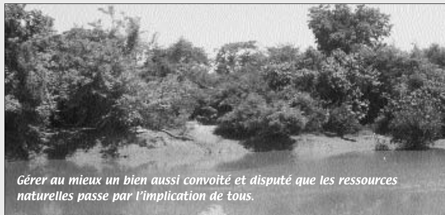
Gérer au mieux un bien aussi convoité et disputé que les ressources naturelles passe par l'implication de tous.

Comment faire converger des intérêts divergents ? C'est tout l'enjeu de la participation. Sur le foncier, cet arbitrage constitue un casse-tête pour tous : organismes de développement, autochtones, migrants... Car dans ce domaine et dans bien d'autres, le changement exige parfois de s'appuyer sur l'ordre établi tout en ayant comme finalité son bouleversement. Ce défi, le Projet de développement local de l'ouest Burkina (PDLO) tente de le relever. Cette opération pilote, de sécurisation foncière dans un contexte de forte migration, recourt entre autres outils, au groupe de réflexion, un cadre d'échanges pour la résolution des conflits fonciers. Graf Infos rend compte de cette expérience de participation locale à travers sa démarche, quelques uns de ses résultats et les contraintes à surmonter, dont celle de la pérennisation des groupes de réflexion.